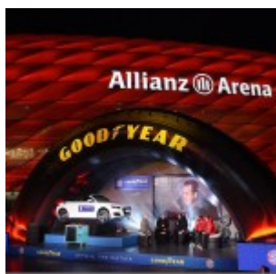
Muenchen 25.11.2015 Der FC Bayern Muenchen praesentiert seinen neuen Platin Partner Goodyear.