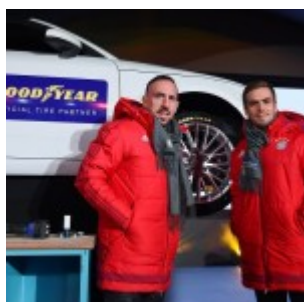
Muenchen 25.11.2015 Der FC Bayern Muenchen praesentiert seinen neuen Platin Partner Goodyear. Franck Ribery (li.) und Philipp Lahm