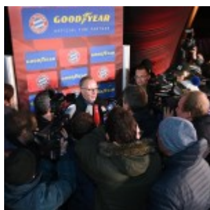
Muenchen 25.11.2015 Der FC Bayern Muenchen praesentiert seinen neuen Platin Partner Goodyear. Vorstandsvorsitzender Karl Heinz Rummenigge beim Interview