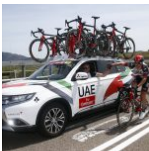
Giro d'Italia 2017 - 100th Edition - 1st stage Alghero - Olbia 208 km - 05/05/2017 - UAE Team Emirates

In dieci anni di collaborazione con Kumho Tyre abbiamo percorso assieme tanti chilometri, raggiungendo importanti traguardi sportivi, non possiamo che augurarci di poter cogliere ancora molte soddisfazioni”.