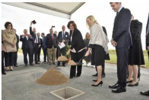
La posa della prima pietra del nuovo centro tecnico di Nokian Tyres in Spagna

Nokian Tyres, nato come specialista dei pneumatici invernali, si è ormai trasformato in un fornitore completo e, a conferma della propria attenzione al settore summer e ai mercati del centro-sud Europa, ha avviato la costruzione di un nuovo centro di test e di ricerca tecnologica in Spagna, a Santa Cruz de la Zarza, cittadina in provincia di Toledo, 80 km a sud est di Madrid. I primi test della pista saranno completati l'anno prossimo e il centro tecnologico dovrebbe essere pienamente operativo nel 2020.