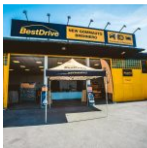
Il punto vendita New Gommauto Brennero