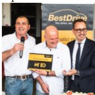
New Gommauto Brennero