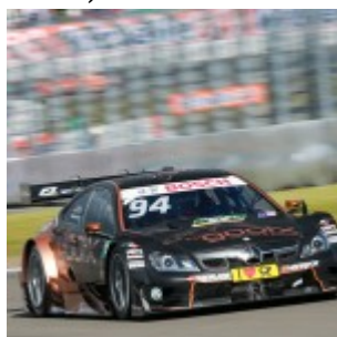
Motorsports: DTM race Nuerburgring, #94 Pascal Wehrlein (GER, Mercedes-AMG DTM Team HWA, Mercedes-AMG C 63 DTM)