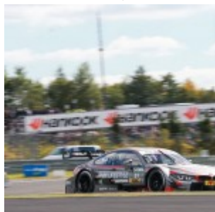
Motorsports: DTM race Nuerburgring, #31 Tom Blomqvist (GBR, BMW Team RBM, BMW M4 DTM)