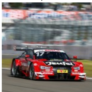
Motorsports: DTM race Nuerburgring, #17 Miguel Molina (ESP, Audi Sport Team Abt Sportsline, Audi RS5 DTM)