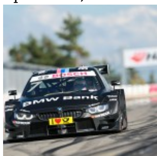
Motorsports: DTM race Nuerburgring, #7 Bruno Spengler (CDN, BMW Team MTEK, BMW M4 DTM)