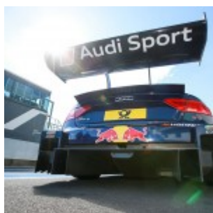
Motorsports: DTM race Nuerburgring, #5 Mattias Ekstroem (SWE, Audi Sport Team Abt Sportsline, Audi RS5 DTM)