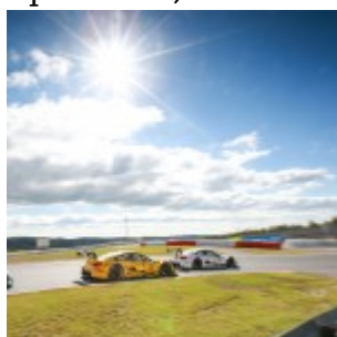
Motorsports: DTM race Nuerburgring, #16 Timo Glock (GER, BMW Team MTEK, BMW M4 DTM)