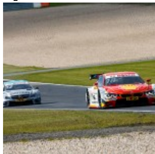
Motorsports: DTM race Nuerburgring, #18 Augusto Farfus (BRA, BMW Team RBM, BMW M4 DTM)