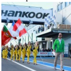
Motorsports: DTM race Nuerburgring