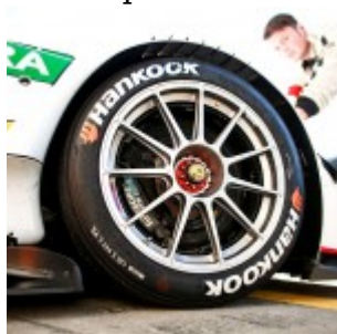
Motorsports: DTM race Nuerburgring Hankook Wheel/Reifen