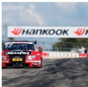
Motorsports: DTM race Nuerburgring, #17 Miguel Molina (ESP, Audi Sport Team Abt Sportsline, Audi RS5 DTM)