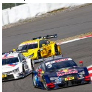
Motorsports: DTM race Nuerburgring, #5 Mattias Ekstroem (SWE, Audi Sport Team Abt Sportsline, Audi RS5 DTM)