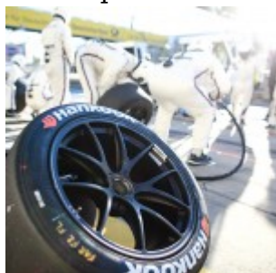
Motorsports: DTM race Nuerburgring Hankook Wheel/Reifen