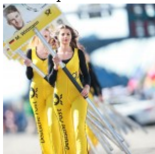
Motorsports: DTM race Nuerburgring