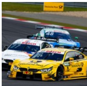
Motorsports: DTM race Nuerburgring, #16 Timo Glock (GER, BMW Team MTEK, BMW M4 DTM)