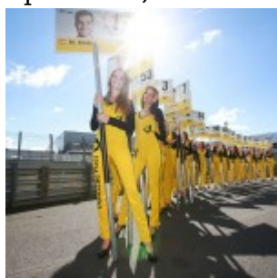
Motorsports: DTM race Nuerburgring, grid girl