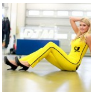
Motorsports: DTM race Nuerburgring, grid girl