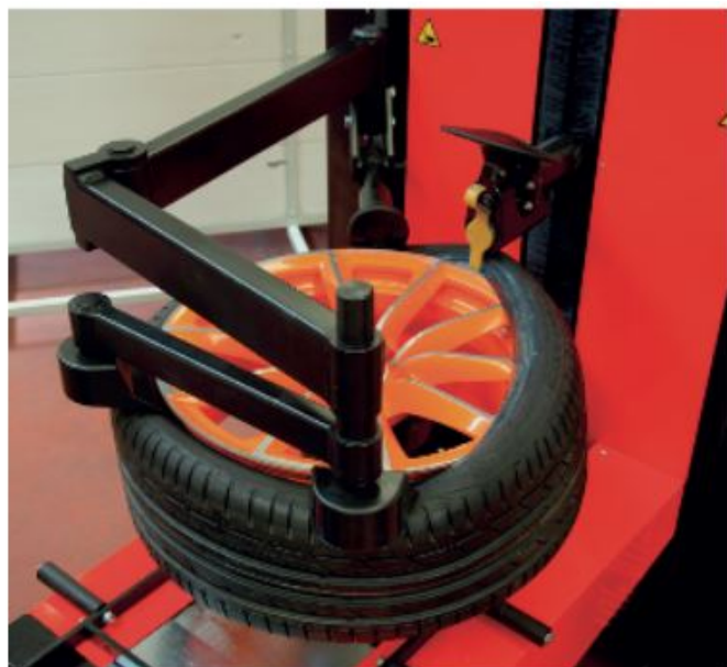
BLOCCAGGIO MANUALE DELLA RUOTA