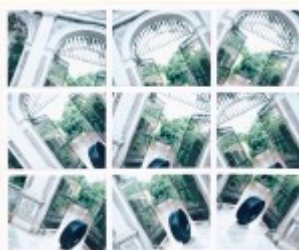
di [unreadable] - [unreadable] - [unreadable]