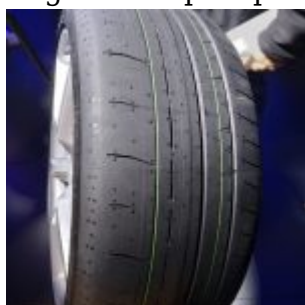
Eagle F1 SuperSport RS