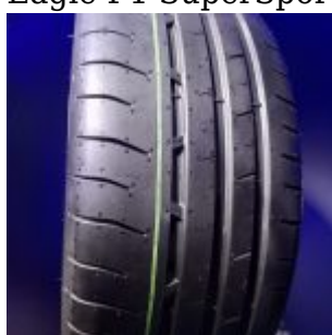
Eagle F1 SuperSport R