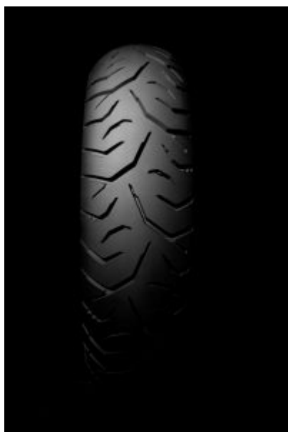
Elevata aderenza - sull'asciutto e sul bagnato

L'innovativo disegno del battistrada del Trailmax Meridian è mirato ed estremamente efficace: è infatti progettato per evacuare l'acqua in modo efficiente alle alte velocità, conservando un'elevata aderenza su asciutto. Il tutto continua sotto il battistrada con la tecnologia Dunlop MultiTread, che comprende una mescola ad alto contenuto di silice in grado di fornire una straordinaria aderenza su bagnato e di rendere il pneumatico più flessibile alle basse temperature. Questa tecnologia, combinata con una carcassa con tele di rayon, offre il duplice vantaggio di un maggiore chilometraggio e di un tempo di riscaldamento molto più rapido, favorendo così i motociclisti che usano le loro moto adventure tutto l'anno. Il pneumatico posteriore presenta anche una nuova mescola centrale che si estende fin sotto la mescola della spalla, contribuendo ad aumentare la rigidità complessiva del pneumatico posteriore e offrendo un comportamento sportivo e maggiore trazione.