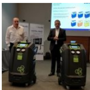
MAHLE ACA NUOVA GENERAZIONE CLIMA

Il successo dei prodotti per il service A/C di Mahle Aftermarket è esploso soprattutto in Europa e Stati Uniti e ha dato un ulteriore impulso all’azienda per continuare nella strada dell’officina 4.0 e nel proporre le proprie soluzioni a chi già opera in questi settori, ma anche ai gommisti e ai professionisti che stanno ampliando l’attività per presentarsi ai propri clienti con un’offerta sempre più vasta e completa. La ricarica clima è per altro uno dei servizi che più facilmente un gommista può implementare, perché è un’operazione relativamente semplice e l’attrezzatura non occupa molto spazio all’interno dell’officina. “L’assistenza per l’aria condizionata è una scommessa sicura, - rimarca Rocchi - perché, calcoli alla mano, in meno di due anni un’officina si ripaga l’investimento. Oggi, con gli aumenti del refrigerante che ci sono stati, diventa un servizio particolarmente importante, che deve essere offerto in modo professionale”.