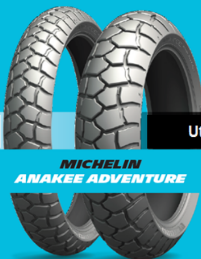
MICHELIN ANAKEE ADVENTURE