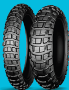
MICHELIN ANAKEE WILD