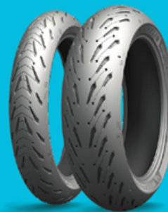
MICHELIN ROAD 5 TRAIL

Michelin Anakee Adventure, le omologazioni in primo equipaggiamento