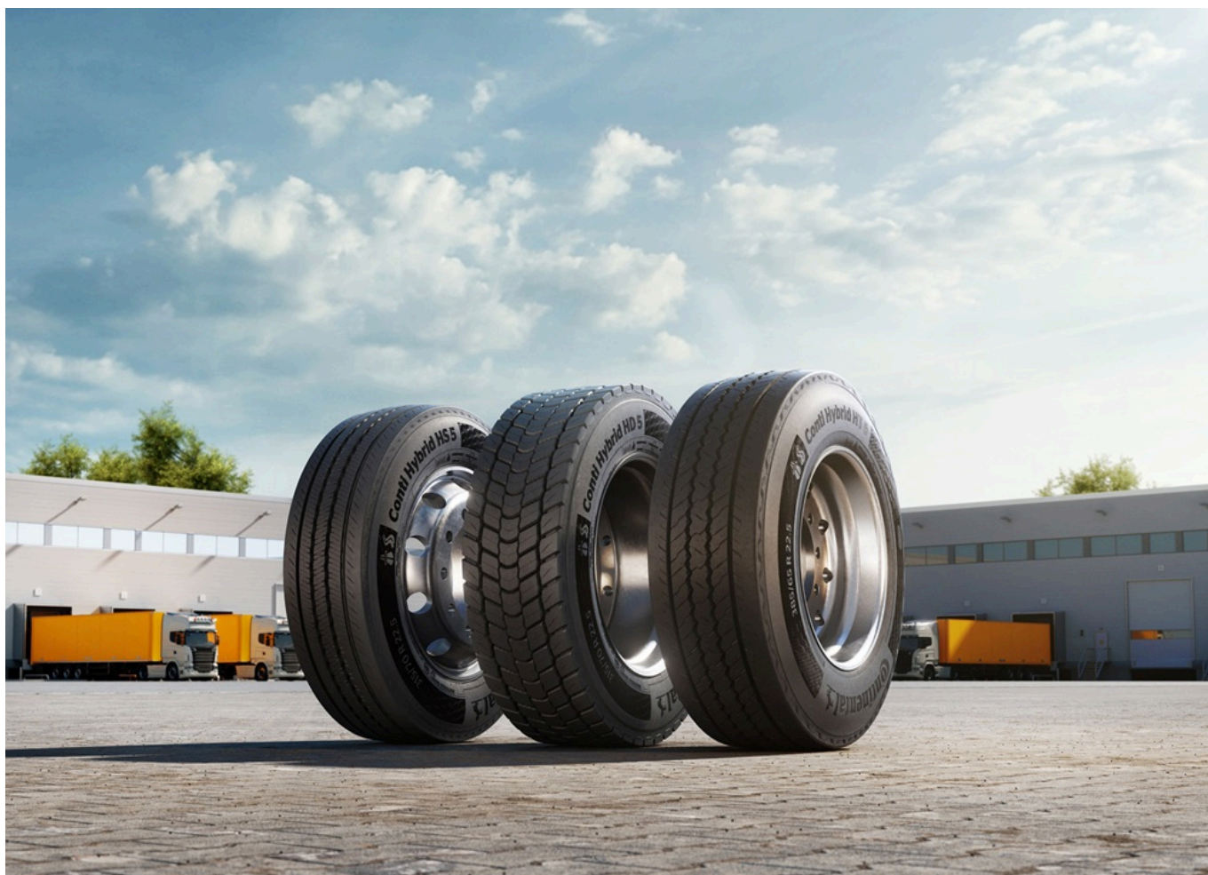
Continental, Padiglione 22P - Stand R01 S10