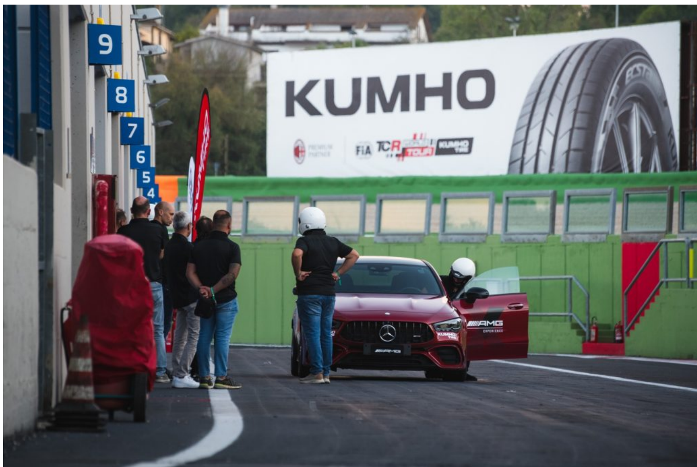
© riproduzione riservata pubblicato il 2 / 10 / 2024