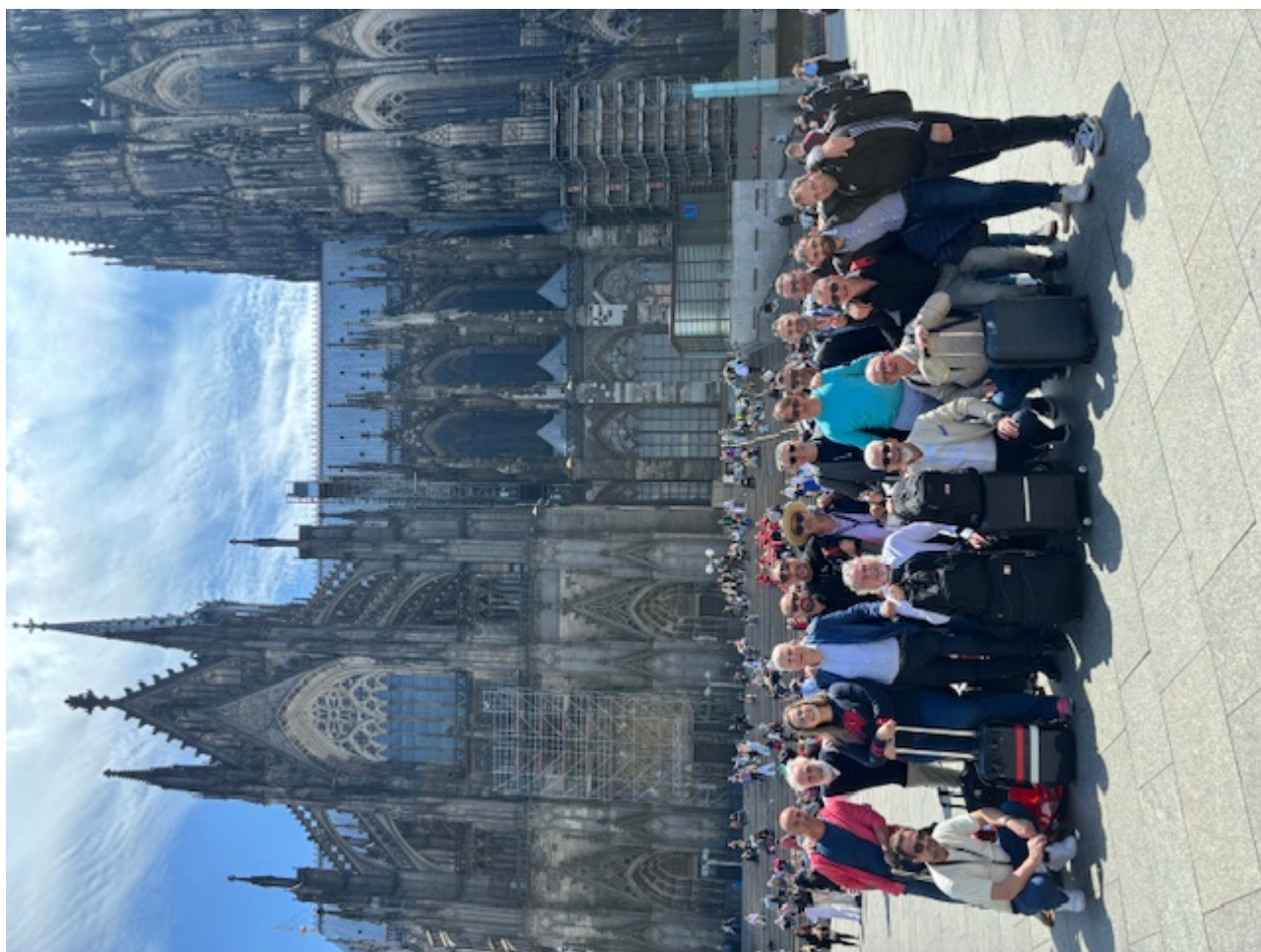
© riproduzione riservata pubblicato il 24 / 06 / 2024