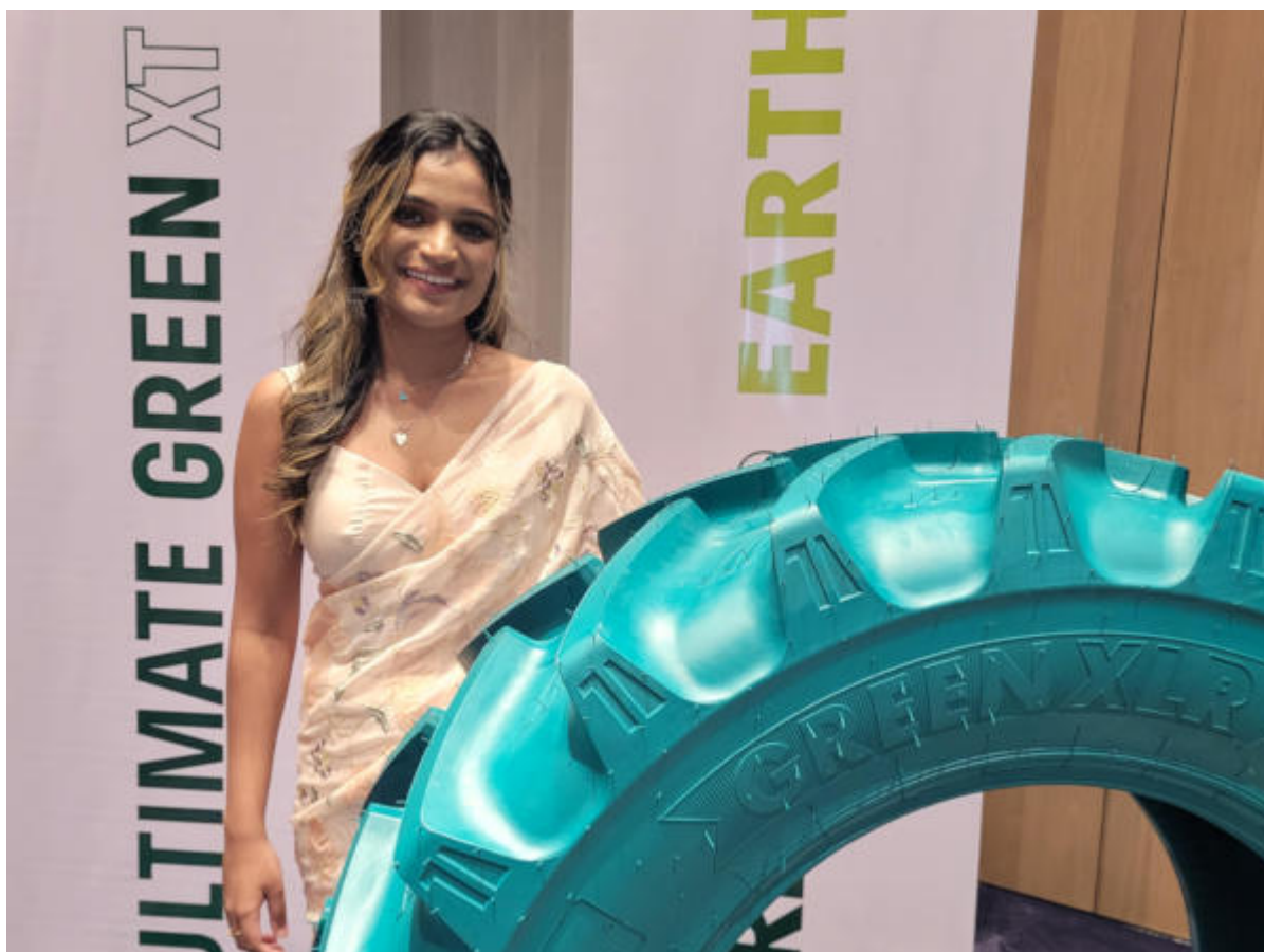
© riproduzione riservata pubblicato il 4 / 03 / 2024