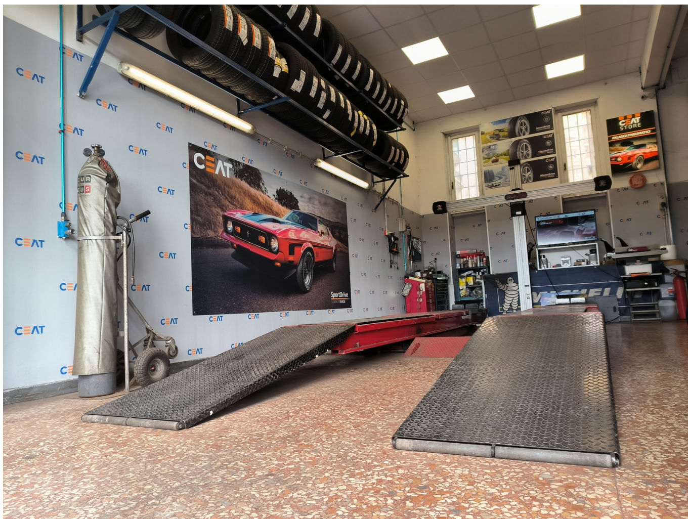
© riproduzione riservata pubblicato il 5 / 02 / 2024