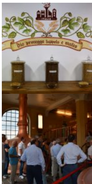
© riproduzione riservata pubblicato il 30 / 07 / 2019