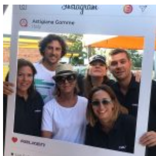
© riproduzione riservata pubblicato il 25 / 09 / 2018