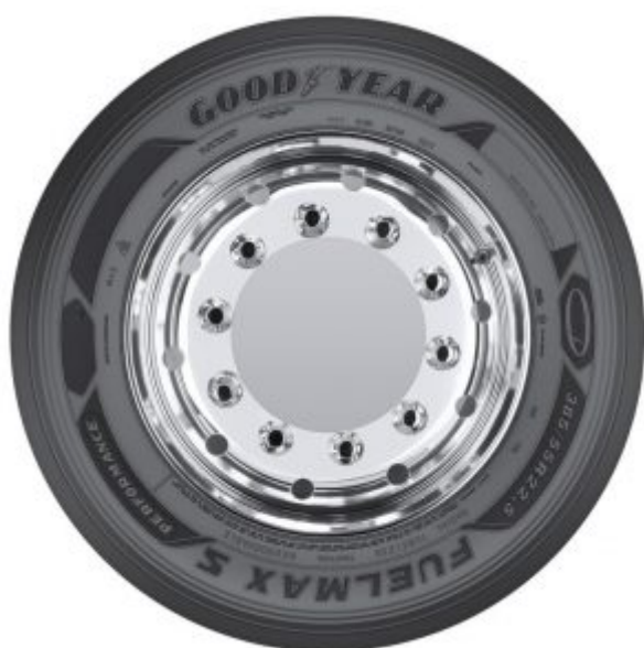
Fuelmax S Performance

Una caratteristica comune a tutta la gamma è la tecnologia RFID (identificazione a radiofrequenza) contenuta all'interno di ciascun pneumatico, che consente una semplice identificazione con un dispositivo esterno che si collega al sistema di gestione dei pneumatici.