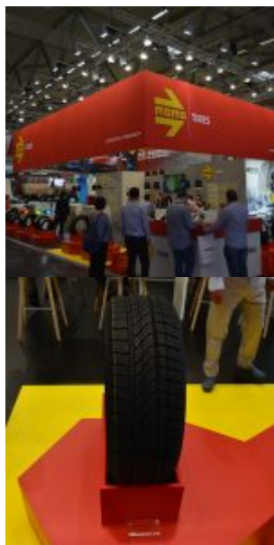
Il nuovo M8