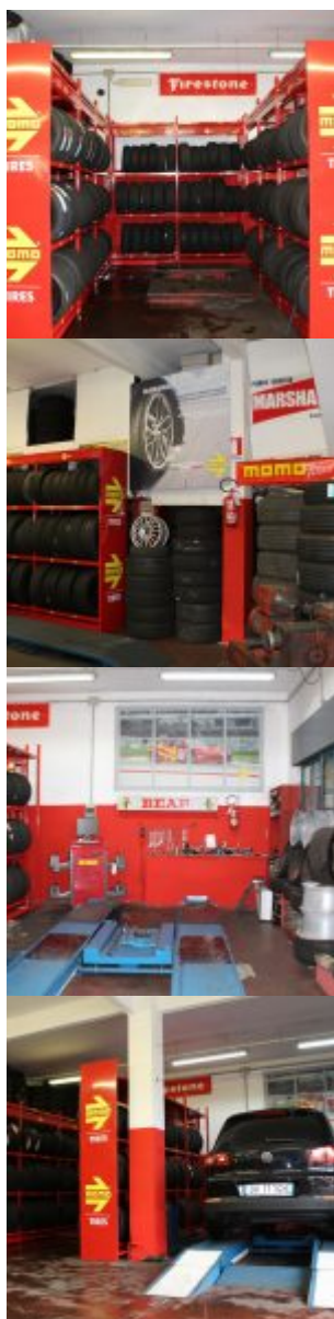
© riproduzione riservata pubblicato il 13 / 06 / 2018