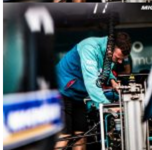
Ambiance during ABB FORMULA E in Roma, Italy, Round 7. 13/04/2018.