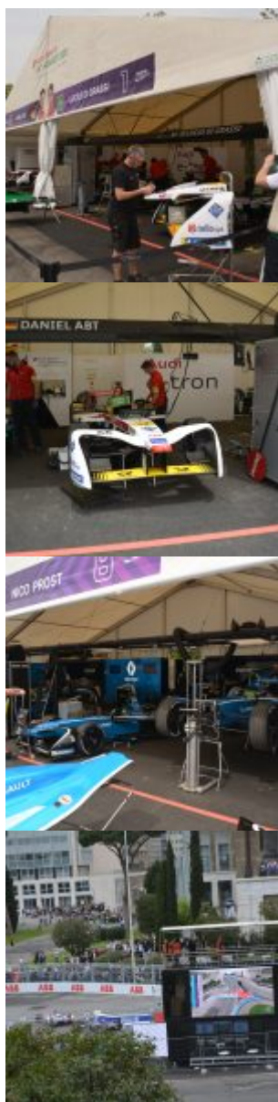
© riproduzione riservata pubblicato il 17 / 04 / 2018