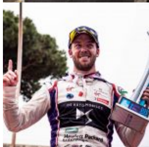
Sam Bird (GBR), DS Virgin Racing during ABB Formula E 2018 Rome E-prix, Round 7,, 20180414 in Rome at Piazza G.Marconi, Italy.