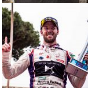
Sam Bird (GBR), DS Virgin Racing during ABB Formula E 2018 Rome E-prix, Round 7,, 20180414 in Rome at Piazza G.Marconi, Italy.