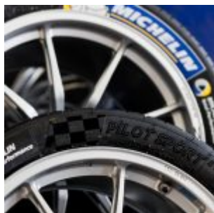
FIA FORMULA E HONG KONG, Round 1, 9 october 2016.