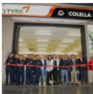
L'inaugurazione di Colella

Come non è stato possibile frenare lo sviluppo e le ripercussioni della rivoluzione industriale, oggi internet rappresenta un cambiamento inarrestabile che può essere solo vissuto come una opportunità per crescere professionalmente e offrire un servizio sempre più completo e al passo coi tempi. Al fine di perseguire questi scopi il gommista dovrebbe affidarsi a marchi distintivi come Kumho Tyre che offrono un supporto strategico continuo tramite il network Kumho Platinum Club. Continuare a migliorare sempre e in ogni modo è l'obiettivo della compagnia Coreana, ben racchiuso nello slogan "Kumho Tyre, Better All-Ways".