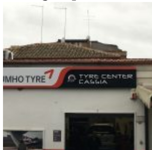
Il Flagship store di Roma