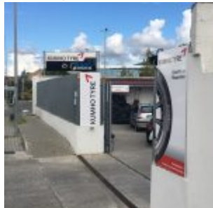
Il Flagship store di Pisa