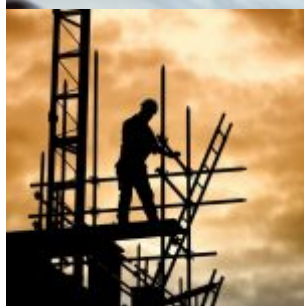
silhouette of construction worker on scaffold