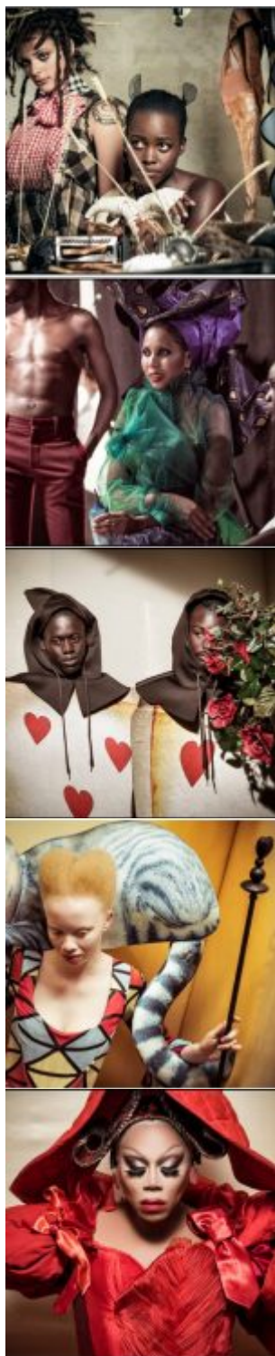
Modelle, attori, un rapper e la drag queen RuPaul (la Regina di Cuori). Sono tutti di colore i protagonisti del Calendario Pirelli 2018