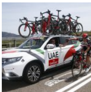
Giro d'Italia 2017 - 100th Edition - 1st stage Alghero - Olbia 208 km - 05/05/2017 - UAE Team Emirates

In dieci anni di collaborazione con Kumho Tyre abbiamo percorso assieme tanti chilometri, raggiungendo importanti traguardi sportivi, non possiamo che augurarci di poter cogliere ancora molte soddisfazioni”.