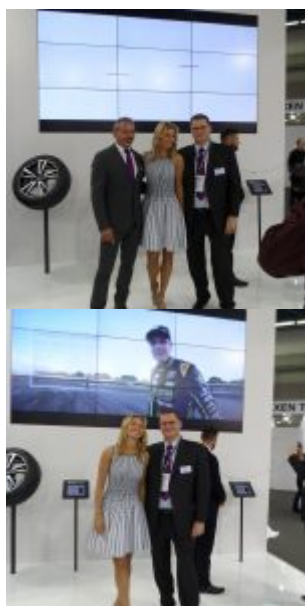
© riproduzione riservata pubblicato il 26 / 06 / 2017