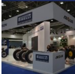
Prometon ad Autopromotec 2017