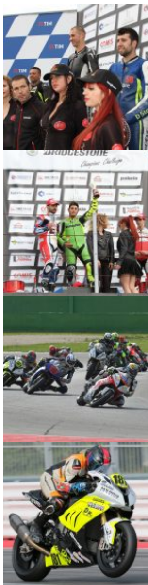
© riproduzione riservata pubblicato il 9 / 05 / 2017