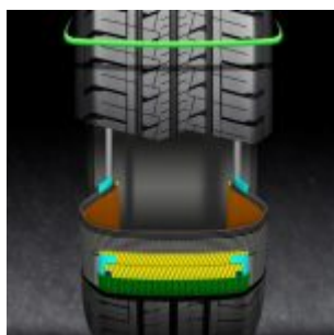
Fulda Conveo Tour 2 tech images

© riproduzione riservata pubblicato il 27 / 04 / 2017