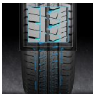
Fulda Conveo Tour 2 tech images