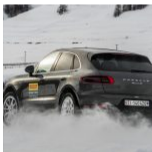
Pirelli Winter Experience