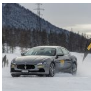
Pirelli Winter Experience

gli atleti tricolore nei campionati del mondo della prossima stagione. Riconferma per il settimo anno consecutivo anche da parte della Swiss-Ski (Federazione sciistica svizzera). L'impegno di Pirelli a fianco della FIS, attraverso Infront Sports and Media, proseguirà anche per le edizioni dei Campionati di Åre (Svezia) 2019 e Cortina 2021, i cui campi di gara, come quello di St. Moritz 2017, si coloreranno del rosso e giallo Pirelli.