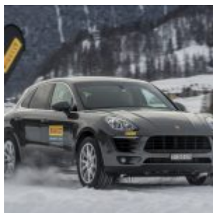
Pirelli Winter Experience