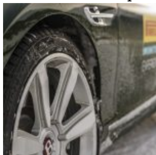
Pirelli Winter Experience