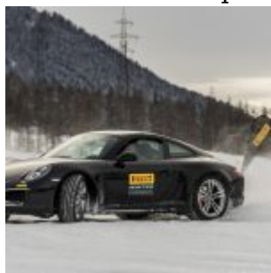
Pirelli Winter Experience