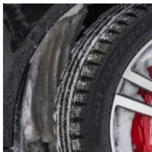
Pirelli Winter Experience