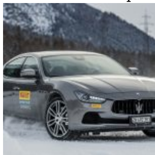
Pirelli Winter Experience