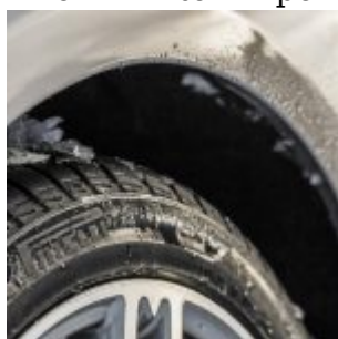
Pirelli Winter Experience