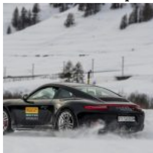
Pirelli Winter Experience