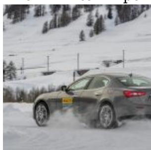
Pirelli Winter Experience