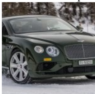
Pirelli Winter Experience