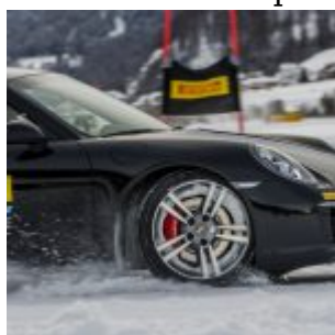
Pirelli Winter Experience