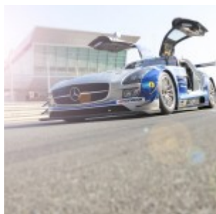
Hankook 24 hours of Dubai 2016