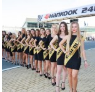
Hankook 24 hours of Dubai 2016