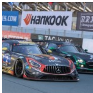
Hankook 24 hours of Dubai 2016