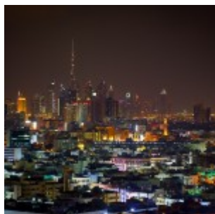
Hankook 24 hours of Dubai 2016