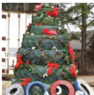
20 Ideas That Help Get Creative With Your Christmas Tree - Best Craft Example