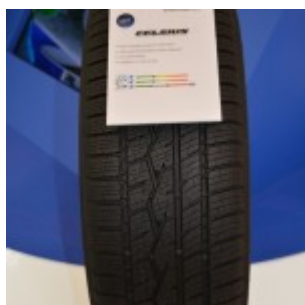
Il nuovo All Season Celsius