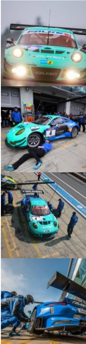
© riproduzione riservata pubblicato il 20 / 05 / 2016