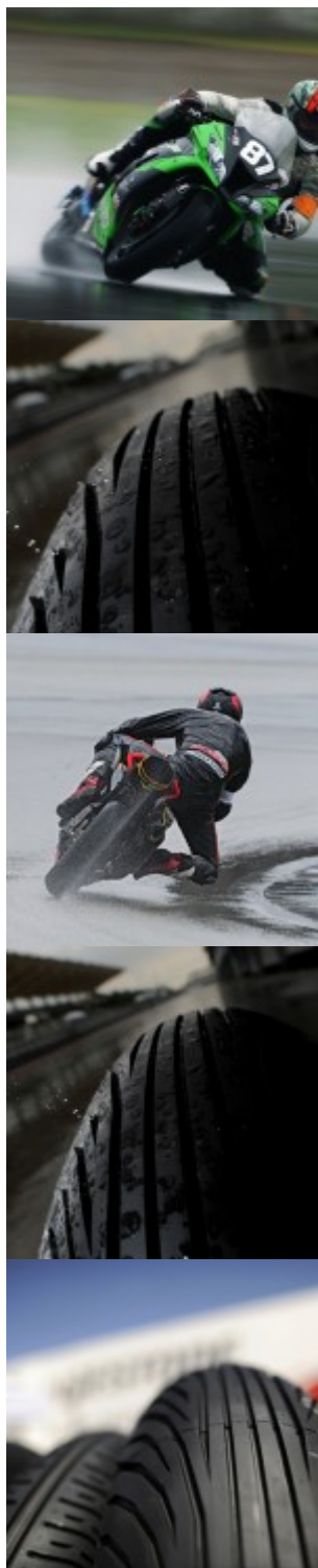
Grand Prix de France, Le Mans, France, 15th May 2011.