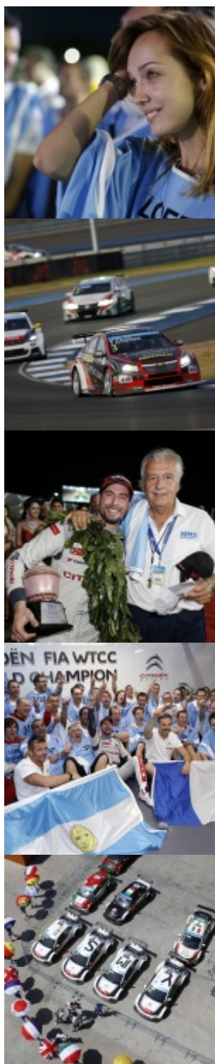
Park Fermé atmosphere during the 2015 FIA WTCC World Touring Car Championship race at Buriram from October 31h to November 1st 2015, Thailand.