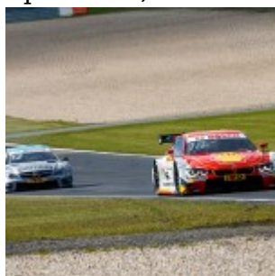
Motorsports: DTM race Nuerburgring, #18 Augusto Farfus (BRA, BMW Team RBM, BMW M4 DTM)

© riproduzione riservata pubblicato il 30 / 09 / 2015