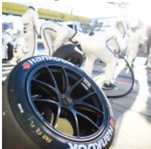
Motorsports: DTM race NuerburgringHankook Wheel/Reifen