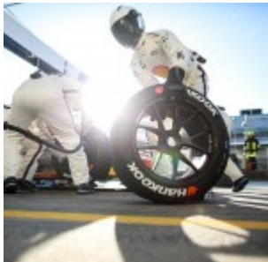
Motorsports: DTM race NuerburgringMechaniker BMW