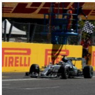
GP ITALIA F1/2015 - MONZA 6/9/15