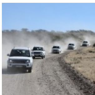
Dusty track in the mountains almost 150 kilometers north of Windhoek.