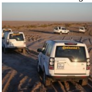
Driving at the beach of Atlantic Ocean near Swakopmund