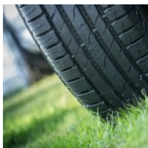
Il Nokian Line SUV

Nokian Line SUV e Nokian zLine SUV vincono i test sui pneumatici estivi SUV 2015 di Auto Bild allrad e Off Road | 2