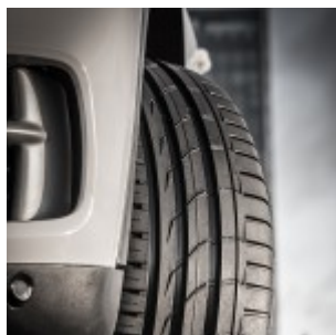
Il Nokian zLine

Nokian Line SUV e Nokian zLine SUV vincono i test sui pneumatici estivi SUV 2015 di Auto Bild allrad e Off Road | 3