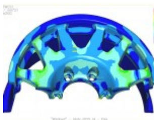
Uno studio FEM per il dimensionamento del cerchio

Infine, Meneghetti afferma che “anche le ruote stradali sono sviluppate, progettate e pensate con le corse in mente. Per esempio, vengono montate le boccole in acciaio nella sede dei dadi, che servono da rinforzo: le ruote da corsa vengono montate e smontate moltissime volte, e questo può danneggiare la sede dei dadi. Con questo sistema si evita questo pericolo. Inoltre il profilo delle razze permette l'installazione di impianti frenanti maggiorati, a tutto vantaggio della sicurezza e delle prestazioni”