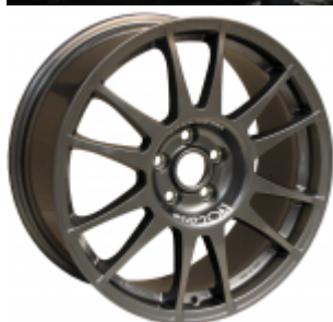
La ruota SanremoCorse da 18", per uso rally o stradale