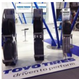
Lo stand al Salone di Zurigo