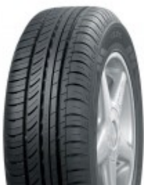
La versione Van del Nokian cLine

© riproduzione riservata pubblicato il 30 / 09 / 2014