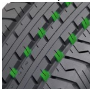
I supporti triangolari del Nokian cLine