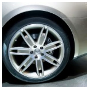
Quattroporte gommata P Zero (2014)