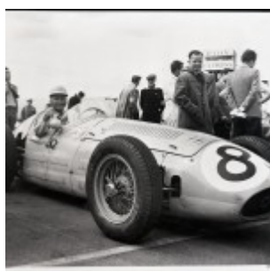
La Maserati del principe Bira gommata Pirelli Stelvio

Le gomme Pirelli sempre più contribuiscono a dare quella personalità unica e inconfondibile a una macchina che, come diceva Fangio, "non è solo un pezzo di ferro ma una creatura viva col cuore che batte....." lungo un secolo italiano di passione e tecnologia.