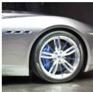
Maserati Alfieri gommata P Zero (2014)