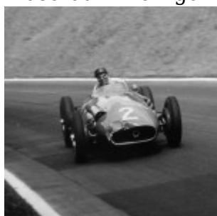
1957 Juan Manuel Fangio © riproduzione riservata pubblicato il 18 / 09 / 2014